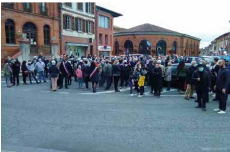
Hommage à Samuel Paty

solennellement une gerbe au monument aux morts de la commune. Nous nous sommes aussi associés lors des journées en mémoire de Samuel Paty, des victimes des attentats qui ont endeuillé 2020 et plus récemment en l'honneur de la disparition du président Giscard d'Estaing.