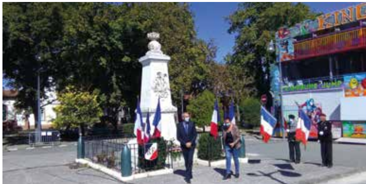
Dépôt de gerbe pour la fête locale

Depuis le premier confinement la municipalité a eu à cœur de célébrer, tout en respectant scrupuleusement les mesures sanitaires, les différentes commémorations nationales ainsi que lors de la fête locale en pavoisant la mairie et en déposant