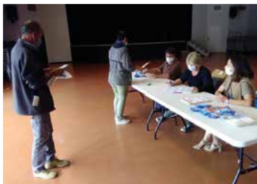
Distribution des masques

Le dernier conseil municipal de cette année 2020 s'est déroulé mardi