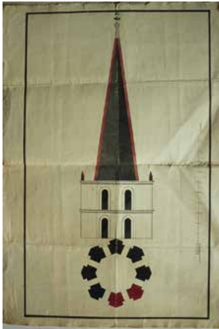
Premier projet de clocher (1813)