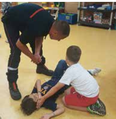
*Service pour l'Inclusion en Accueil Collectif de Mineurs

Les enfants se sont pleinement investis dans ces propositions et ont également très apprécié les différentes sorties : piscine, baignade au lac de Saramon et labyrinthe de Merville.